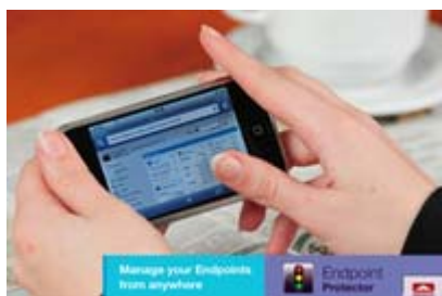
My Endpoint Protector App

My Endpoint Protector App, lancée par CoSoSys, est un outil pour prévenir la perte de données, le vol d'identité et gérer l'utilisation des dispositifs mobiles sur la route.